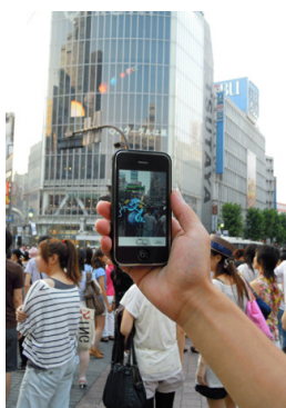
リアル空間で移動し、よりエイリアンに近づく

エイリアンは1回の攻撃で倒れるとは限りません。同じ地域の人たちが協力しながらその地域のエイリアンを撃退していきます。プレイヤーの「地球防衛」貢献度に合わせて装備が強化できるようになり、よりエイリアンを撃退しやすくなっていきます。