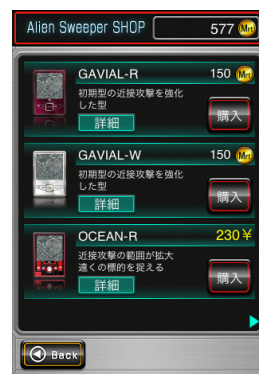
エイリアンを撃退するシステムは様々な機動があるより強くなるもの機動変更可能状況に応じて使い分け