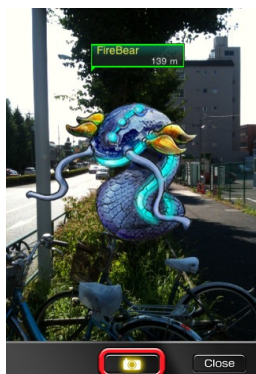
エイリアンを映像化するARスコープ