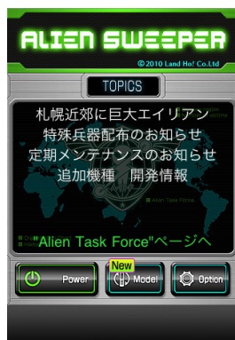
アプリのトップ画面 新着のお知らせが確認できる